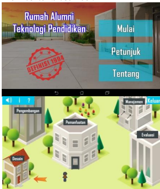
Gambar 1. Menu Utama Game Android Domain TP

Hasil perencanaan meliputi referensi berupa panduan teknis, bahan ajar, situs internet, perangkat lunak, serta tenaga ahli. Sumber-sumber referensi tersebut meliputi (1) sumber materi Domain TP, (2) sumber tentang pembuatan game Android (Unity 3D), (3) sumber aset-aset game (grafis dan suara, berlisensi distribusi bebas bersyarat, agar dapat diambil dan dimodifikasi sesuai kebutuhan). Brainstorming telah menghasilkan gagasan-gagasan baru terkait penelitian dan pengembangan lebih lanjut, seperti bentuk media, rancangan instruksional, kemasan materi, serta informasi terkait sumber.